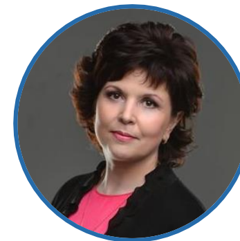
О. Н. РЫСЕВА Министр образования Кировской области