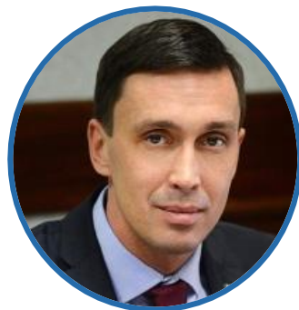
Д.А. КУРДЮМОВ Первый заместитель Председателя Правительства Кировской области

ФУНКЦИОНАЛЬНЫЙ ЗАКАЗЧИК РЕГИОНАЛЬНОГО ПРОЕКТА