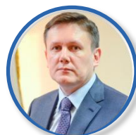
А.А. ЧУРИН Председатель Правительства Кировской области