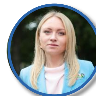
А.А. АЛЬМИНОВА Министр спорта и молодежной политики Кировской области