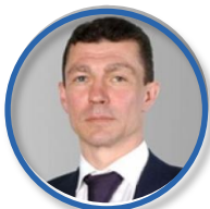
М.А. ТОПИЛИН Министр труда и социальной защиты Российской Федерации