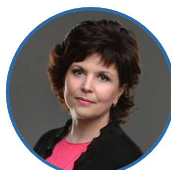
О. Н. РЫСЕВА Министр образования Кировской области

ФУНКЦИОНАЛЬНЫЙ ЗАКАЗЧИК РЕГИОНАЛЬНОГО ПРОЕКТА