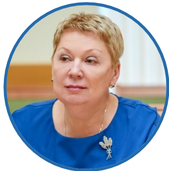
О. Ю. ВАСИЛЬЕВА Министр просвещения Российской Федерации