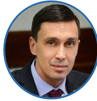
Д.А. КУРДЮМОВ Первый заместитель Председателя Правительства Кировской области

ФУНКЦИОНАЛЬНЫЙ ЗАКАЗЧИК РЕГИОНАЛЬНОГО ПРОЕКТА