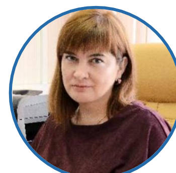
Е.С.ВОРОНКИНА Заместитель министра образования Кировской области