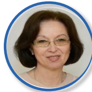
А.В. АЛБЕГОВА Министр охраны окружающей среды Кировской области