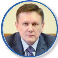
А.А. Чурин Председатель Правительства Кировской области