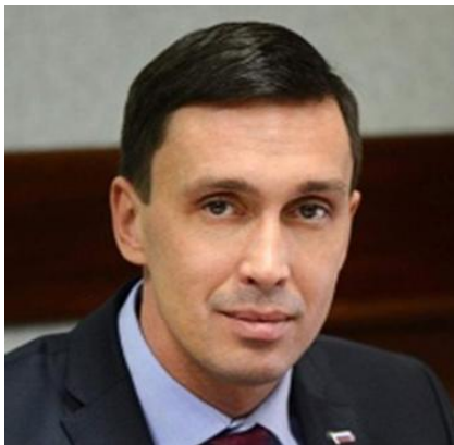
Д.А. Курдюмов Первый заместитель Председателя Правительства Кировской области