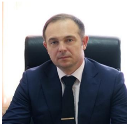
С.В. Стяжкин Заместитель министра образования Кировской области