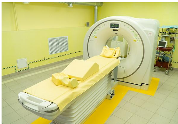
компьютерный томограф в Детский клинический консультативно- диагностический центр

поступило в медицинские организации г. Кирова и районов Кировской области, оказывающие медицинскую помощь детям, в том числе