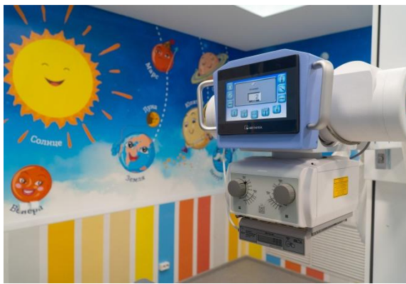
цифровые рентгеновские аппараты в Кировскую городскую больницу №5 Омутнинскую ЦРБ, Яранскую ЦРБ